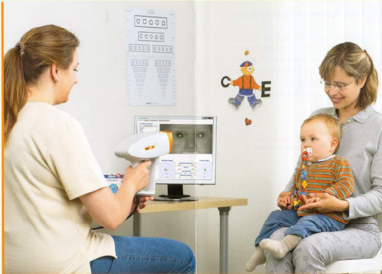
Mit moderner Messtechnik von Plusoptix dauert die Refraktionsmessung nur wenige Sekunden.

Ein wichtiger Bestandteil der Augenvorsorge ist die Refraktionsmessung. So kann schon bei Säuglingen festgestellt werden, ob sich die Augen altersgerecht entwickeln.